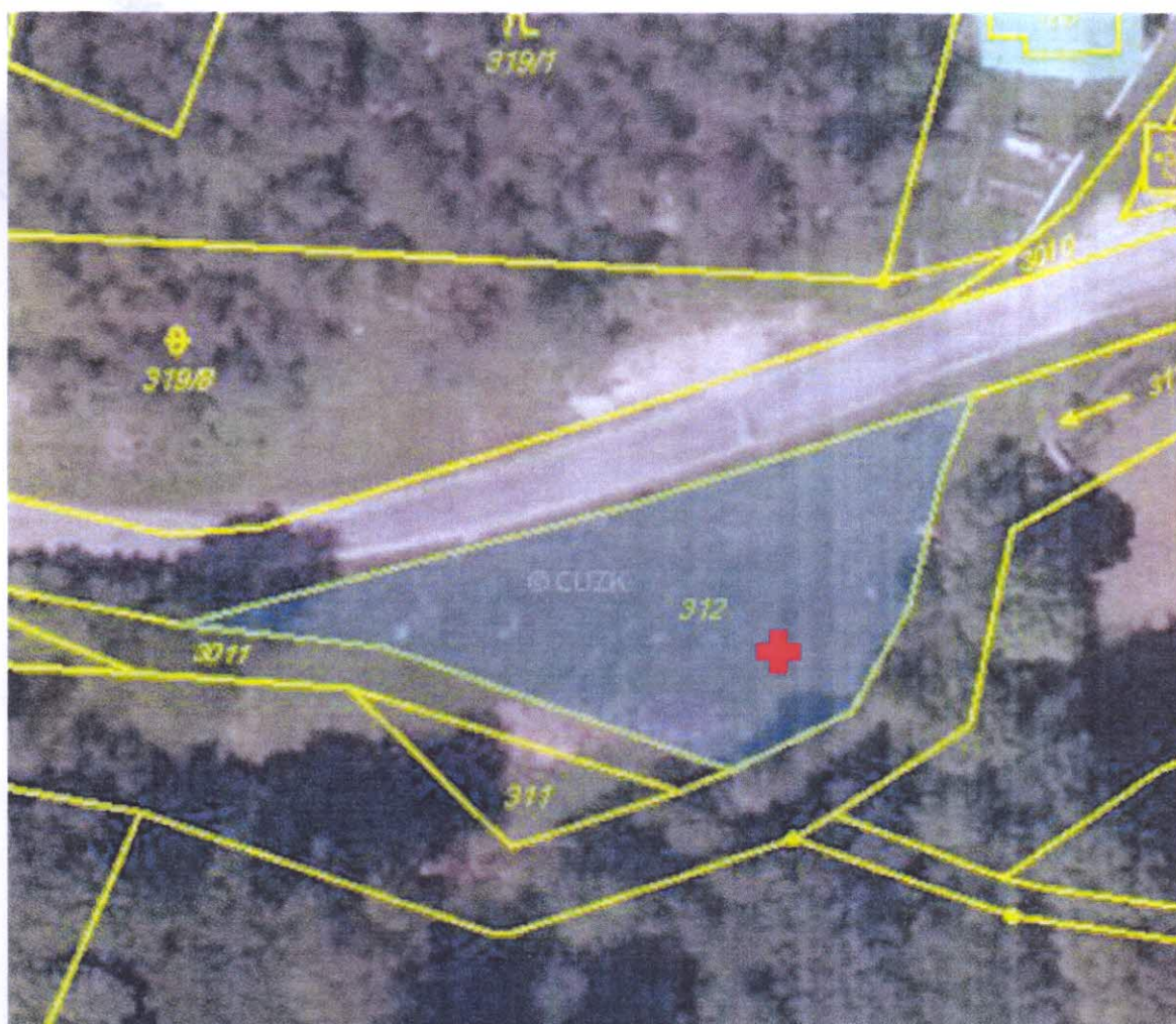
Obrázek 2 Výřez z katastrální mapy. Červený křížek plánované označuje umístění sochy.