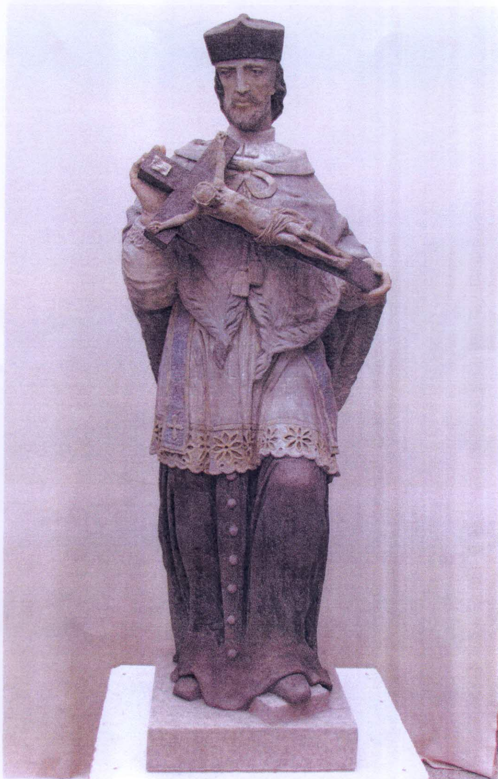
Obrázek 1 Socha sv. Jana Nepomuckého zatím bez svatozáře stříšky a podstavce. Celkový pohled na sochu bude možný až po instalaci.