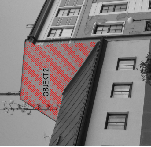
OBJEKT 2 - FASADA ČP. 18 - ŠTÍT SMĚREM K ČP. 19 - SEVER