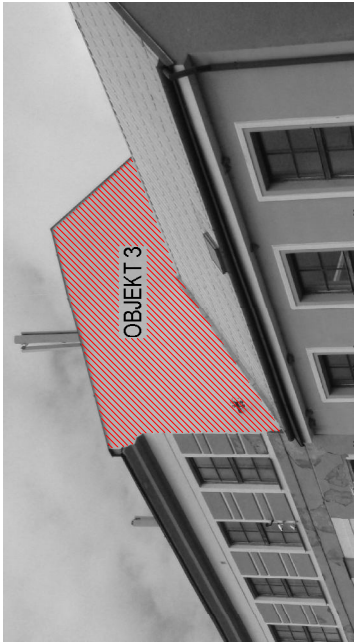
OBJEKT 3 - FASADA ČP. 18 - ŠTÍT SMĚREM K ČP. 17 - JIH