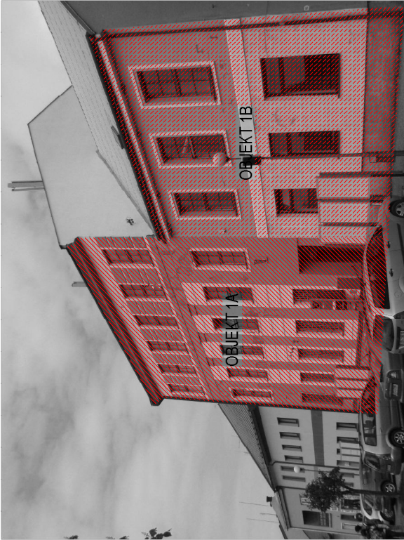
OBJEKT 1A - FASADA ČP. 18 - SMĚREM DO NÁMĚSTÍ - ZÁPAD