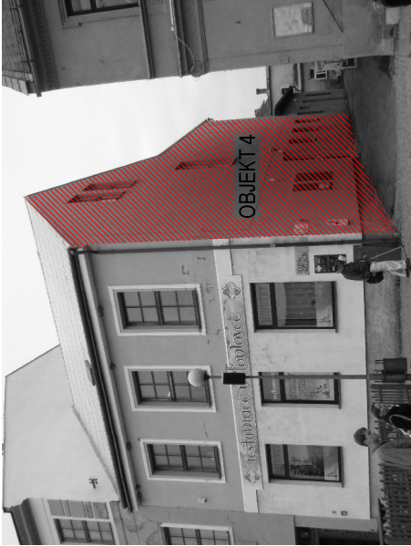
OBJEKT 4 - FASADA ČP. 17 - SMĚREM DO ULÍČKY - JIH